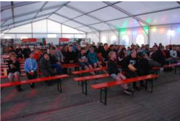
Am Abend gab es auf der Bühne scheinbar Interessantes zu betrachten.

Montagsmorgen. In der Regel ist das der schlimmste Zeitpunkt der Woche. Da in Dorum derzeit die Gesetze der arbeitenden Bevölkerung allerdings weitestgehend außer Kraft gesetzt sind, freuten sich 450 Nachwuchsfeuerwehrkameraden und ihre Betreuer auf den Tag, an dem die Programmrochade langsam Fahrt aufnehmen sollte. Bereits früh am Morgen machten sich die ersten Gruppen auf zu einer Wattwanderung – unter anderem!