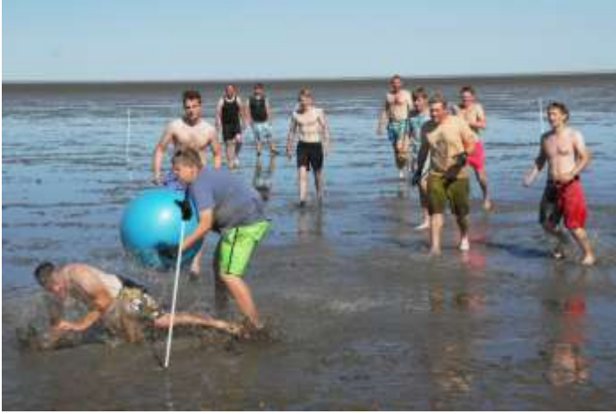
Voller Körperseinsatz beim Wattfußball zeugte von der gesunden Portion Motivation.

„Unter anderem“ deshalb, da die ersten Gruppen direkt an Ort und Stelle zur großen Wattolympiade antraten und in den Disziplinen „Wattfußball“, „Wattkegeln“, „Watttauziehen“, und „Wattschlittenziehen“ gegeneinander um olympisches Gold kämpften. Das noch unerprobte Event bestand seine Feuertaufe, alle Teilnehmer hatten sichtlich Spaß und im Nachgang wahrscheinlich auch Mühe, sich gänzlich vom am Körper klebenden Watt zu befreien.