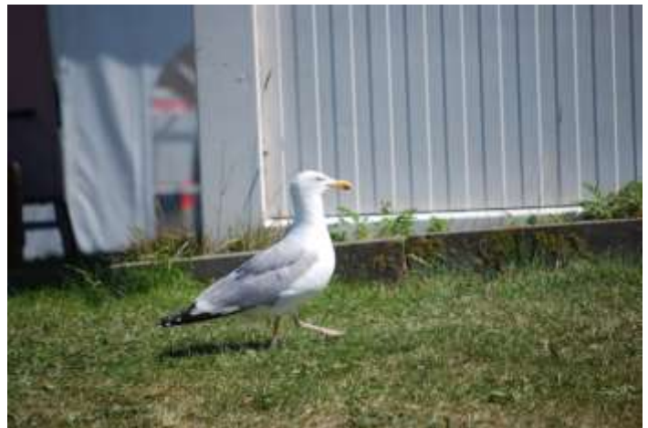
Hasst es , wenn man sie fälschlicherweise „Weißkopfsesadler“ nennt: Eine Taube.

„Unter anderem“ deshalb, da die ersten Gruppen direkt an Ort und Stelle zur großen Wattolympiade antraten und in den Disziplinen „Wattfußball“, „Wattkegeln“, „Watttauziehen“, und „Wattschlittenziehen“ gegeneinander um olympisches Gold kämpften. Das noch unerprobte Event bestand seine Feuertaufe, alle Teilnehmer hatten sichtlich Spaß und im Nachgang wahrscheinlich auch Mühe, sich gänzlich vom am Körper klebenden Watt zu befreien.